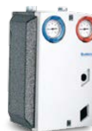
HSM15 – 25