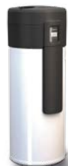
Logatherm WPT 270